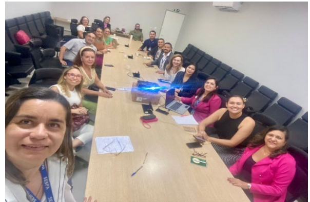
Câmara Técnica de Oncologia – SESP