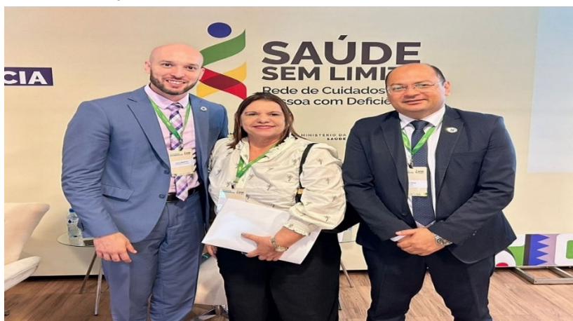
I Encontro Nacional da Rede de Cuidados à Pessoa com Deficiência

Ao todo, o evento contou com três painéis, sendo eles: A Política Nacional de Atenção Especializada e o Programa Mais Acesso Especialistas, A gestão do cuidado na Rede de Cuidado à Pessoa com Deficiência e Qualificando a Rede de Cuidado à Pessoa com Deficiência.