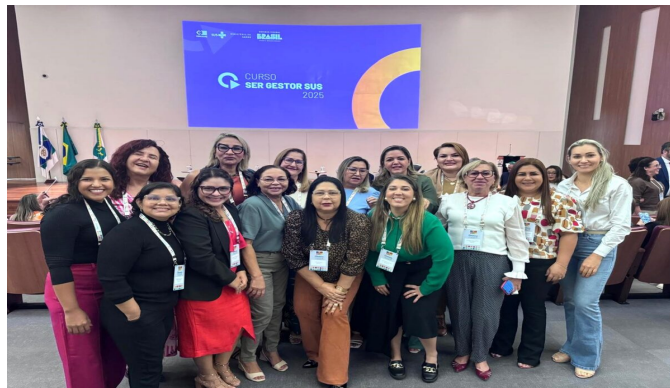
Seminário Ser Gestor SUS 2025

Matéria sobre a participação do grupo do Projeto Rede CONASEMS- COSEMS/PA, no Seminário Ser Gestor SUS 2025, que ocorreu em Brasília/DF.