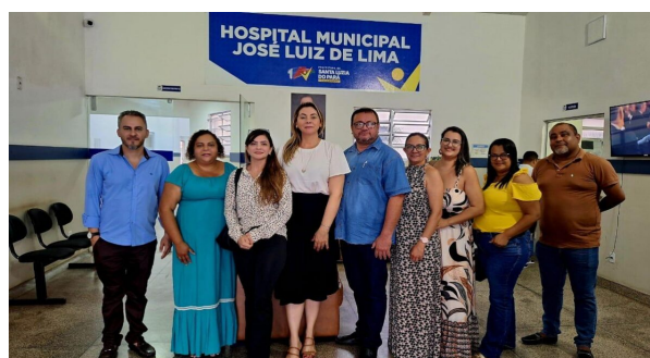
CIR da Região dos Caetés

Cobertura da reunião da CIR da Região dos Caetés, que aconteceu de forma itinerante em Santa Luzia do Pará.