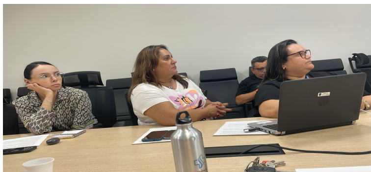
Reunião Saúde Digital e Telessaúde Marajó