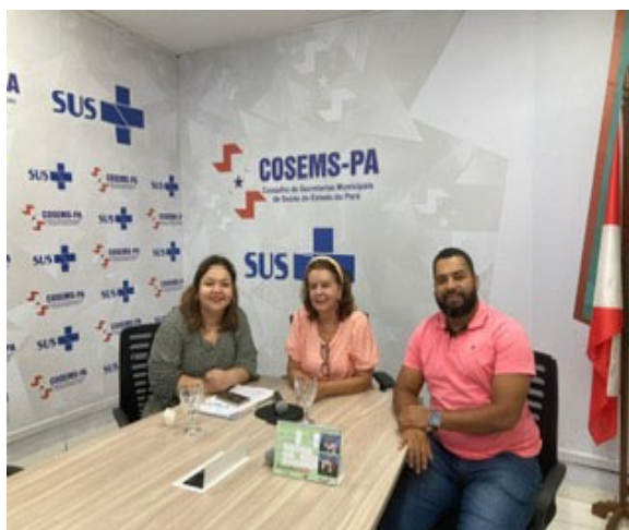
Reunião PMAE – COSEMS