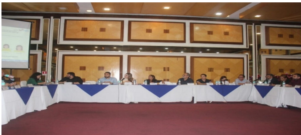
CIB DE DEZEMBRO

Foram premiados os 12 trabalhadores da IV Mostra “Pará, aqui tem SUS” e oito pelo ImunizaSUS, que foram selecionados na etapa estadual. A cerimônia ocorreu durante a reunião da CIB e contou com a presença de secretários de saúde e técnicos do estado e municípios.