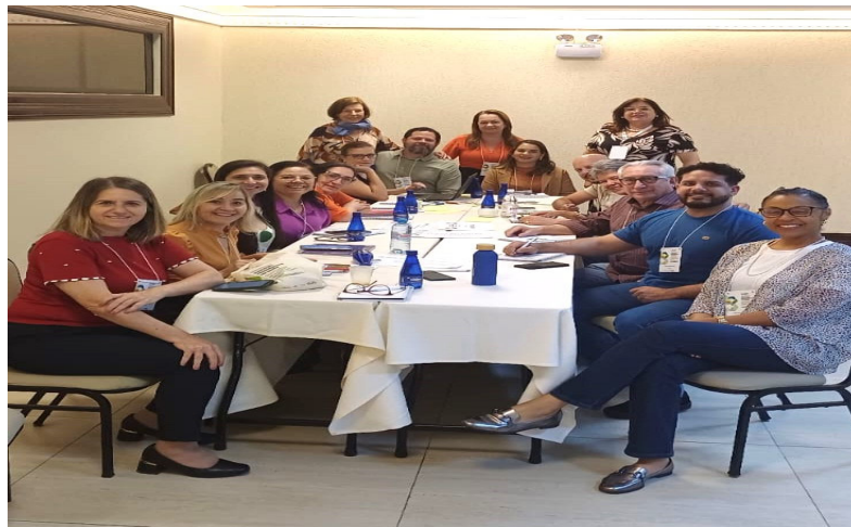
Educação em saúde é tema de oficina nacional