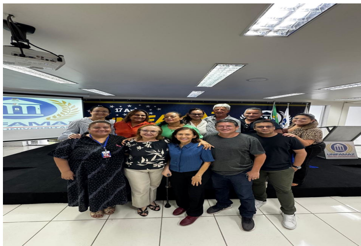
Oficina do Planejamento Regional Integrado com grupo de trabalho macrorregionais I, II, III e IV