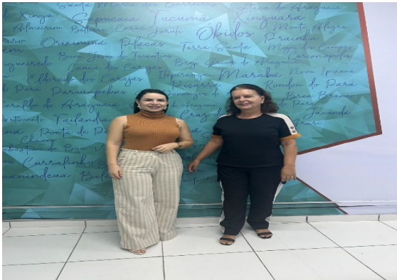
Reunião com a SMS de Saúde De Tucumã – Cosems