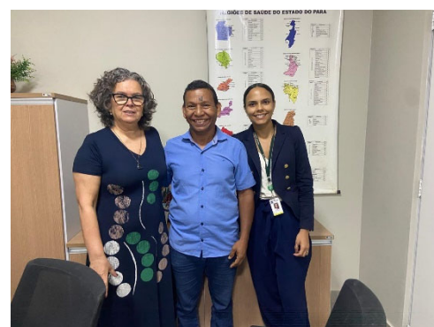
Representantes do MS