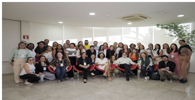
Capacitação sobre o manejo e a ampliação ao DIU de cobre

Matéria sobre o treinamento em saúde sexual e reprodutiva, promovido pelo UNFPA, Ministério da Saúde, SESPA e o COSEMS-PA, em São Paulo.