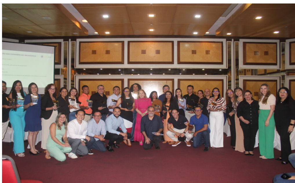
Experiências exitosas recebem premiação do Cosems Pará