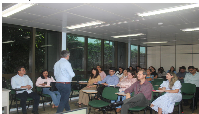
Oficina da vigilância de vírus respiratórios

Cobertura da Oficina Mosaico (Metodologia para o Plano de Enfrentamento) – Aprimoramento da Vigilância dos Vírus Respiratórios. Promovida pelo Ministério da Saúde, Conass e a Opas.