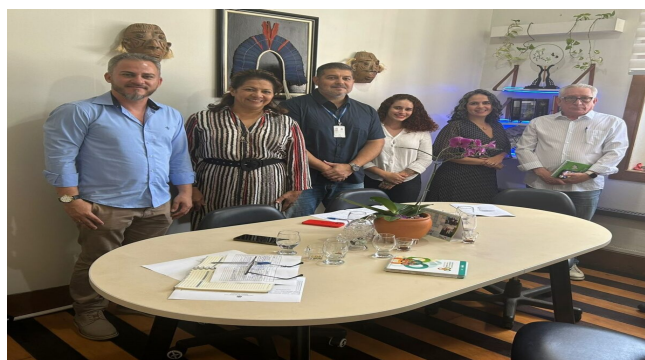
Reunião do Cosems/PA com a UEPA

Produção de matéria sobre a reunião do Cosems/PA com a UEPA para tratar de assuntos referentes ao Curso de Especialização em Saúde Coletiva na Região de Saúde do Rio Caetés.