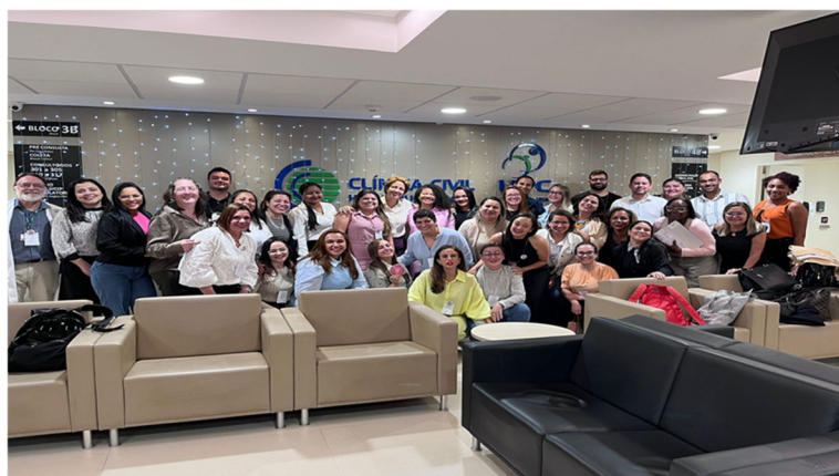
Oficina de Treinamento de Inserção de DIU/Ribeirão Preto