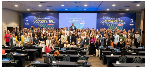
Reunião de Dirigentes das Vigilâncias em Saúde

Matéria sobre a Reunião de Dirigentes das Vigilâncias em Saúde aos representantes das Secretarias Estaduais e Municipais de Saúde dos 26 estados e do Distrito Federal, em Brasília/DF.