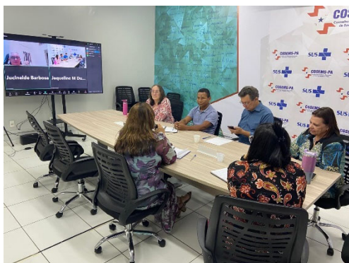
Reunião de Trabalho Técnicos