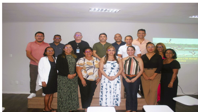
CIR Marajó I

Cobertura da reunião ordinária da Comissão Intergestores Regional (CIR) do Marajó I, na sede do COSEMS/PA.