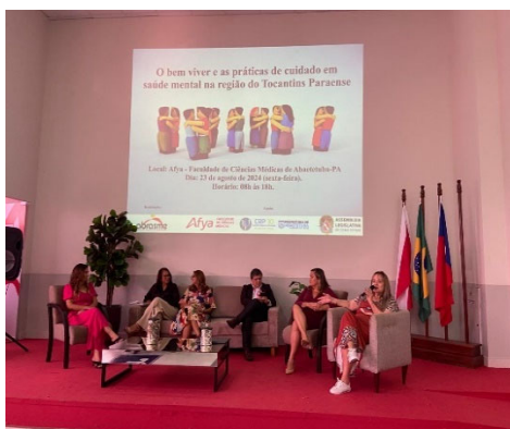
Pré-congresso de psicologia