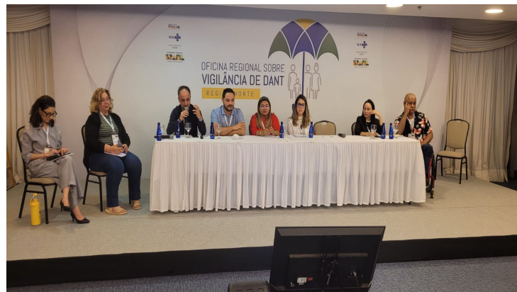
Oficina Nacional de DANT