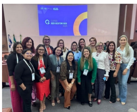
Oficina “Ser Gestor” Rede Oficina De Coordenadores De Apoio