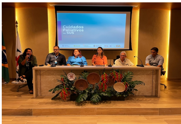
Evento do Proadi-SUS sobre cuidados paliativos

Cobertura do evento do PROADI-SUS, no auditório do Hospital Ophir Loiola, lançamento do novo ciclo do projeto “Cuidados Paliativos no SUS”, executado pelo Hospital Sírio-Libanês. O COSEMS/PA se fez presente por meio dos representantes dos quatro municípios que compõem o projeto (Marituba, Barcarena, Belém e Breves).