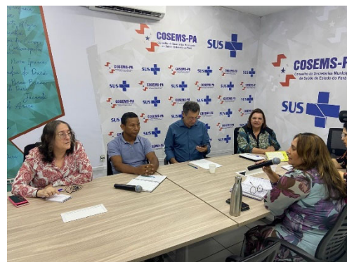
Técnicos do Cosems-Pa