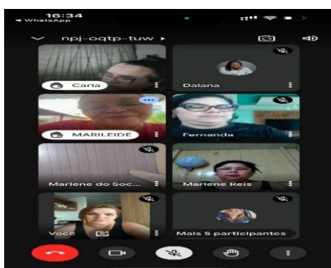
Reunião Rede Permanente