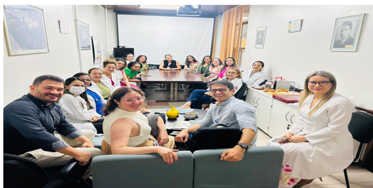
Visita com Grupo Conductor Estadual dos Cuidados Paliativos ao Hospital Barros Barreto