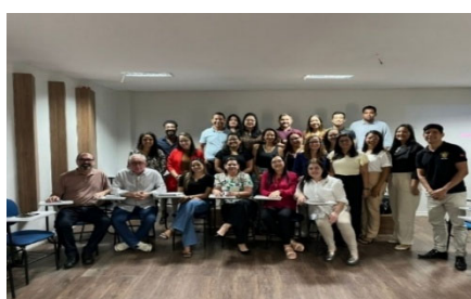
Visita Apoiadoras M.S