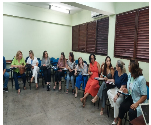
Reunião DGPSUS – UEPA