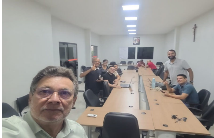
Reunião da Comissão Permanente de Vigilância Em Saúde CES-PA