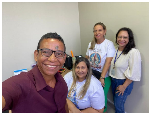
Assistência Farmacêutica SESP