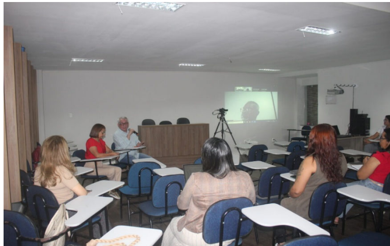
Oficina no Cosems/PA elabora Plano de Ações do GTI-E do Programa Saúde na Escola do Pará