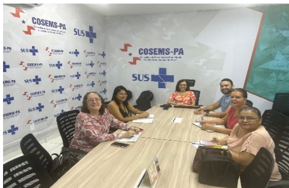
Reunião Programa Mais Acesso a Especialistas – PMAE