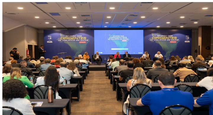
Reunião Nacional de Dirigentes de Vigilância Em Saúde