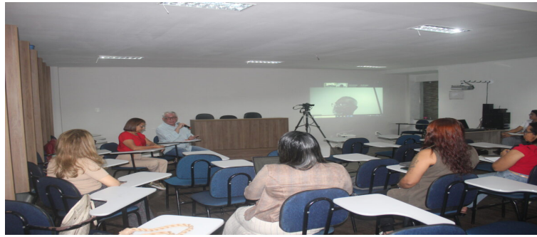
GT Intersetorial do Programa Saúde na Escola

Cobertura da Oficina para Elaboração do Plano de Ação do Grupo de Trabalho Intersetorial do Programa Saúde na Escola do Pará, realizada no COSEMS/PA.