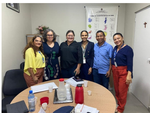
Comitê estadual de saúde menta.