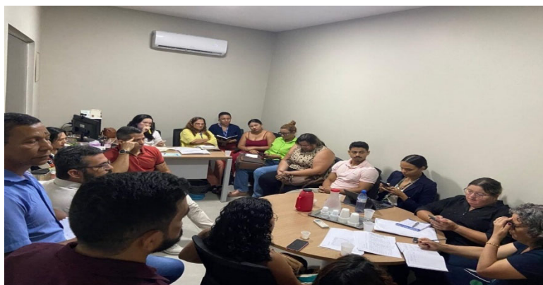
Cosems/PA participa de reunião sobre o Novo PAC no Marajó