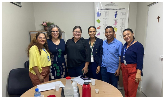
Obras do Novo PAC no Marajó