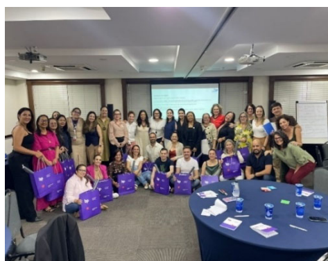
Aula Presencial Curso DFTS