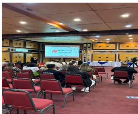
Cerimônia de Premiação Mostra Pará